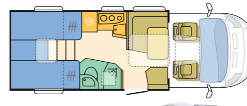
Beispiel Comfort Class