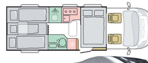
Beispiel Family Class