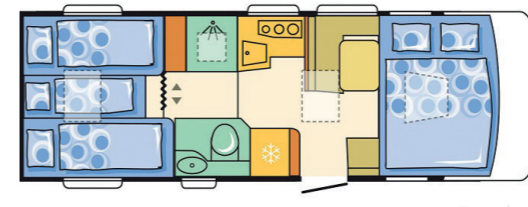
Beispiel Luxury Class